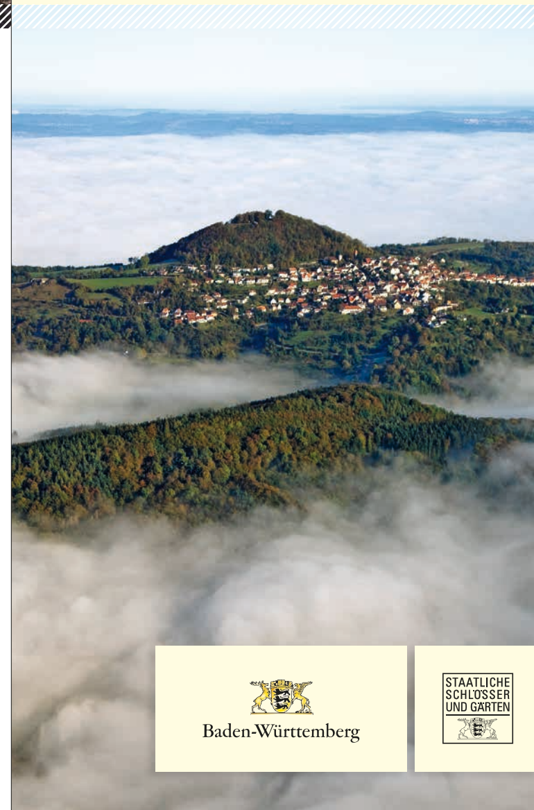
BILD: MICHIELS SSG / LMZ; TITELBILD: Roland Siggere; 1: Achim Mredek; 2: Rolf Schwarz; 3: Nick Schübner; 4: Dieter Dehnen; 5: Veronika und Bau BW / 7: Designkonzept: www.jungkommunikation.de